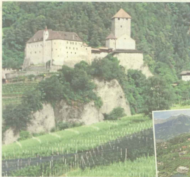
Nicht nur Weinberge, sondern auch über 150 Burgen und Schlösser gibt es in der norditalienischen Grenzregion zu entdecken.

Um das gute Essen und den hervorragenden Tiroler Wein sacken zu lassen, bietet sich der Aufstieg zu einer der zahlreichen Almen im Meraner Land an. Kleine braune Farbtupfer bilden sie an den steilen, grünen Hängen, die enge Täler um-