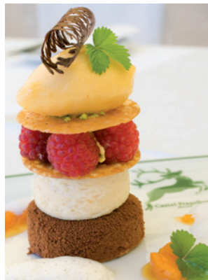
Duetto von der Schlossgartenmarille und der edlen Valrhona-Schokolade | Duetto di albicocche del giardino del castello e di nobile cioccolato Valrhona

Rezept finden Sie auf Seite 115 | Per la ricetta vedere a pag. 115